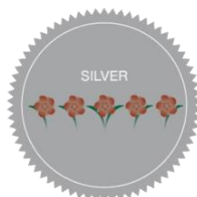
5 Fleurs - Argent