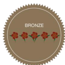
5 Fleurs - Bronze

Il y a quatre niveaux de 5 fleurs qui seront exclusifs aux collectivités évaluées dans l'édition nationale et internationale. 5 Fleurs : 82 à 83.9% / 5 Fleurs (Bronze) : 84 à 86.9% / 5 Fleurs (Argent) : 87 à 89.9% / 5 Fleurs (Or) : 90% et plus