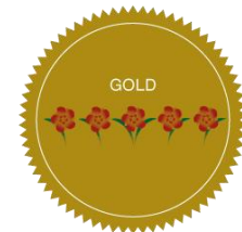
5 Fleurs - Or