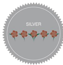
5 Fleurs - Argent