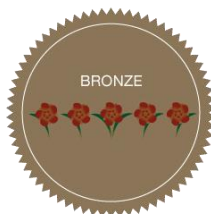
5 Fleurs - Bronze

Il y a quatre niveaux de 5 fleurs qui seront exclusifs aux collectivités évaluées dans l'édition nationale et internationale. 5 Fleurs : 82 à 83.9% / 5 Fleurs (Bronze) : 84 à 86.9% / 5 Fleurs (Argent) : 87 à 89.9% / 5 Fleurs (Or) : 90% et plus