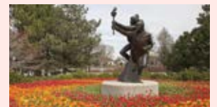
Jardin olympique, Canal Rideau