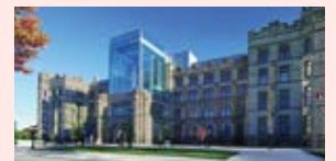
Musée canadien de la nature