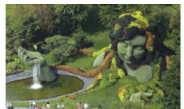
Terre Mère, Mosaïcultures Internationales de Montréal