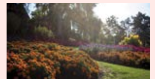
Parc des Commissaires