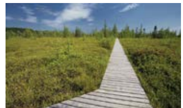
Tourbière de la Mer Bleue

Le domaine Mackenzie-King est un legs inestimable. Ce domaine champêtre a appartenu à William Lyon Mackenzie King, le 10 e premier ministre du Canada, qui est resté le plus longtemps en poste. À son décès, et après avoir passé près de 50 ans à embellir et à agrandir sa propriété (de 1903 à 1950), King a légué son domaine au peuple canadien.