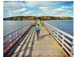
Nova Scotia Celtic Shores