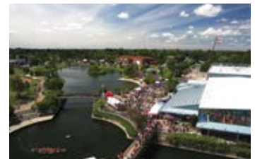
Strathcona County, Alberta – Hôte 2018