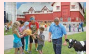
Musée de l'agriculture et de l'alimentation